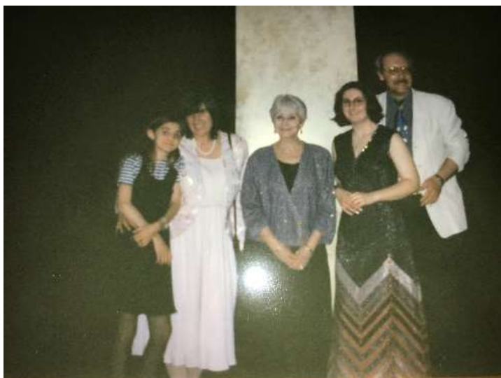
Feier 30 Jahre AS mit Renilde Montessori