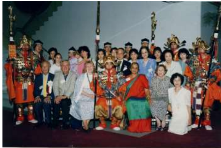
国際モンテッソーリ第21回世界大会 1993年7月24日-27日 新 奈良県立総合会館